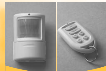
MS18 PIR Motion Sensor