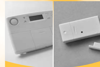
SC28 Security Base Console