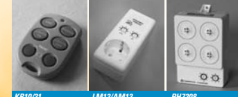
KR10/21 Keyfob Remote