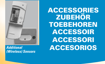
Additional (Wireless) Sensors

ACCESSORIES ZUBEHÖR TOEBEHOREN ACCESSORI ACCESORIOS