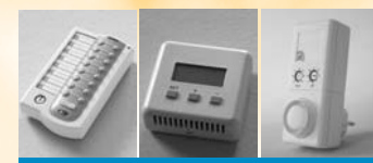
SH600 Full Function Remote Control