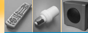
UR24 Universal Remote